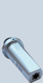
Registro de Datos LAN