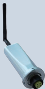
Registro de Datos GPRS