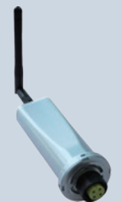
Registro de Datos WiFi